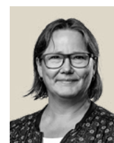
Lisbeth Fjordvald Scandi Byg