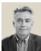
Henrik L. Bang Bygherreforeningen