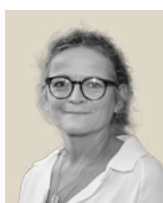
Sidse Buch BAT Kartellet