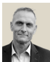
Finn Bloch Nye Grønne Værksteder, DSB